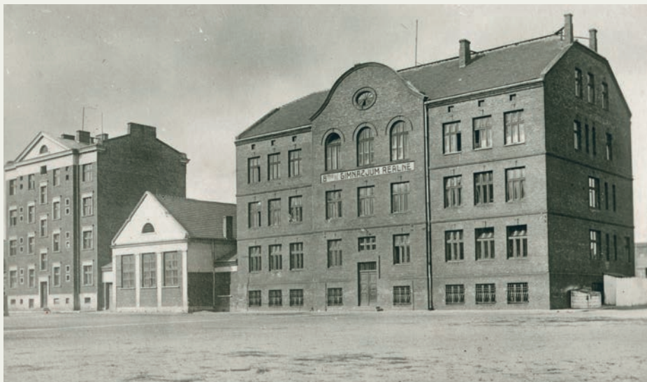
Budynek dawnego Gimnazjum Realnego, a następnie Gimnazjum i Liceum im. Adama Skwarczyńskiego, lata 30. XX w.

W Żyrardowie w ostatnich miesiącach 1939 r. wielu nauczycieli podjęło się z własnej inicjatywy tajnego nauczania.