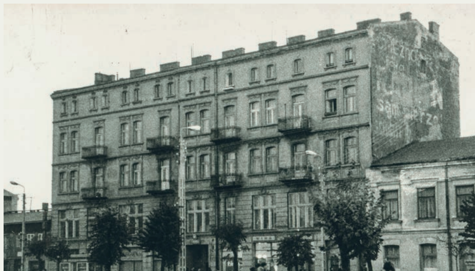
W tym budynku w latach 1940-1943 mieściła się Miejska Szkoła Handlowa w Żyrardowie.

Tajne Nauczanie odbywało się zgodnie z przedwojennym programem szkoły średniej ogólnokształcącej. Przedwojenny program szkoły średniej realizowany był równolegle w Miejskiej Szkole Handlowej, na Kursach Przygotowawczych do Szkół Zawodowych oraz w Szkole Rzemieślniczo-Tkackiej. Wykładany był w prywatnych domach, mieszkaniach nauczycieli i uczniów. Szkoły te chroniły polską młodzież przed zesłaniem na przymusowe roboty do Niemiec. W Miejskiej Szkole Handlowej młodzież szkolna zdobywała wiedzę z klas 1 i 2, natomiast na Kursach Przygotowawczych realizowano materiał klas wyższych, oraz przygotowywano do egzaminu maturalnego.