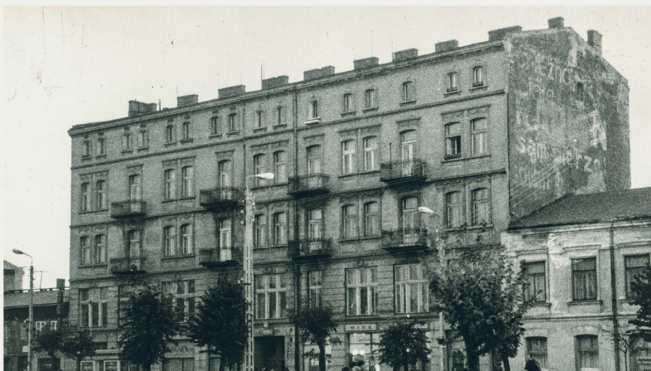
W tym budynku w latach 1940-1943 mieściła się Miejska Szkoła Handlowa w Żyrardowie.

Tajne Nauczanie odbywało się zgodnie z przedwojennym programem szkoły średniej ogólnokształcącej. Przedwojenny program szkoły średniej realizowany był równoległe w Miejskiej Szkole Handlowej, na Kursach Przygotowawczych do Szkół Zawodowych oraz w Szkole Rzemieślniczo-Tkackiej. Wykładany był w prywatnych domach, mieszkaniach nauczycieli i uczniów. Szkoły te chroniły polską młodzież przed zesłaniem na przymusowe roboty do Niemiec. W Miejskiej Szkole Handlowej młodzież szkolna zdobywała wiedzę z klas 1 i 2, natomiast na Kursach Przygotowawczych realizowano materiał klas wyższych, oraz przygotowywano do egzaminu maturalnego.