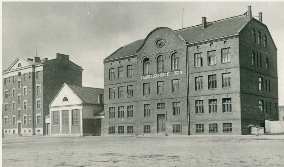
Budynek dawnego Gimnazjum Realnego, a następnie Gimnazjum i Liceum im. Adama Skwarczyńskiego, lata 30. XX w.

W Żyrardowie w ostatnich miesiącach 1939 r. wielu nauczycieli podjęło się z własnej inicjatywy tajnego nauczania.