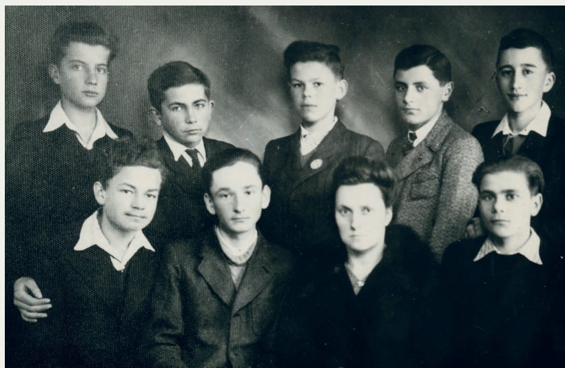
Tajne komplety, rok szkolny 1944/45, klasa II Jąminy Kacperskiej (siedzi 3 od lewej).