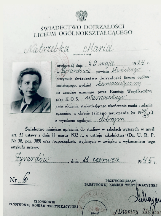
Świadectwo dojrzałości Marii Nietrzebki, I Komplet Tajnego Nauczania w Miejskiej Szkole Handlowej w Żyrardowie.